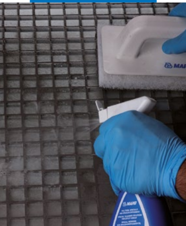
Sprayen van Kerapoxy Cleaner op het te reinigen oppervlak