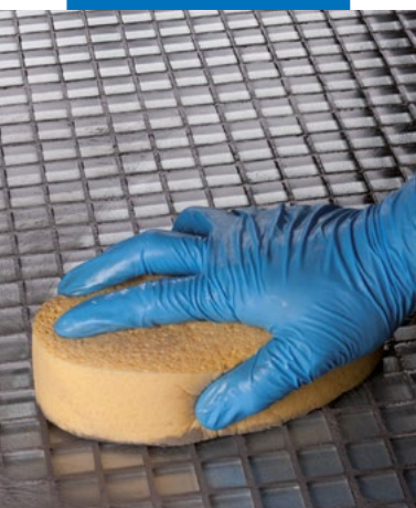
Afnemen met een spons