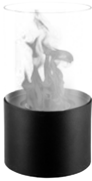
Fig 1 FFB 017