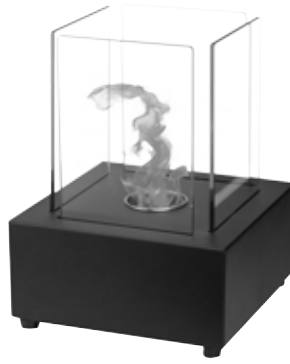
Fig 2 FFB 022